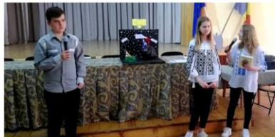
Căștigătorii "CDIdei în cărți", pasionații mureșeni ai culturii generale

▲ ALIN ZAHARIE | ● 21 MAI 2019 | ■ INVITAMENT | ● LASA UN COMENTARIU | ● 943 VIZUALIZATE